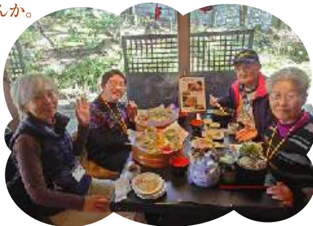
お昼も美味しくいただきました!

南足柄市身体障害者福祉協会では、会員を募集しています。活動は、協寺子屋事業や福祉教育への協力、会員交流のためのバス研修やポッチャ交流会などを実施しています。ご興味のある方は社協ボランティアセンター(722299)までご連絡ください。