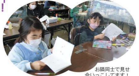
お隣同士で見せ 合いっこしています!