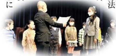
昨年度の「ふくしの標語」表彰式

今年度の応募方法については、7月初旬に、社協ホームページに掲載し、小学校を通じて応募用紙を配布する予定です。今年も多くの素敵な標語に出会えることを楽しみにしています。