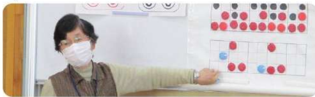
小学生に点字の基礎を教える会員