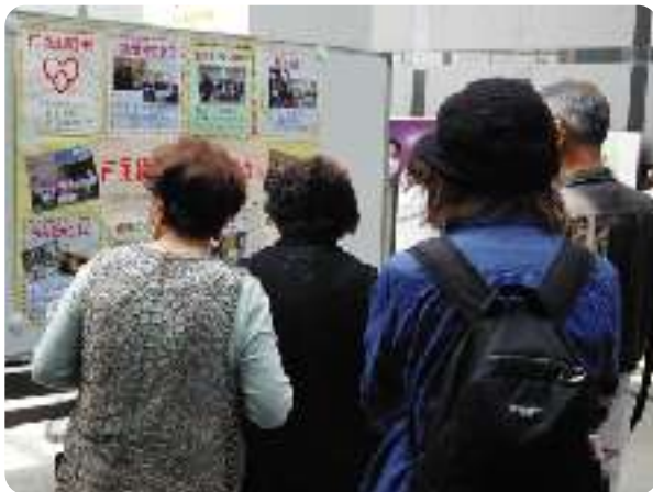
パネルの前で足を止める来場者