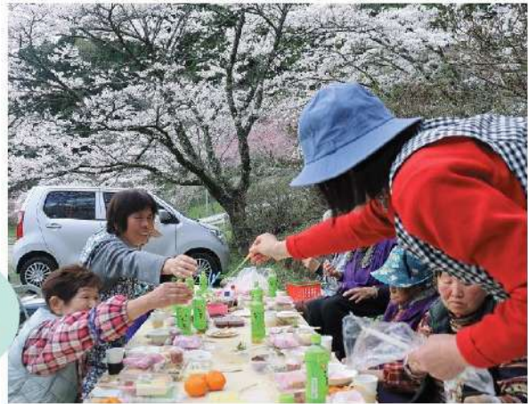
「美味しいね、これだれが作ったの?」