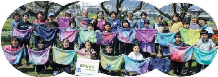
色彩豊かなエコバッグが完成

3月30日(木)、あしがらアートの森の皆さんを講師にエコバックを絞り染めで作りました。大きいビーズやペットボトルキャップなどを輪ゴムで止めて、自分の好きな色で染めました。染める色は1色の子もあれば3色使っても染め上げる子もおり、同じ色を使っても染まり方や模様が違う、自分だけのエコバックを作ることができました。(中部公民館)