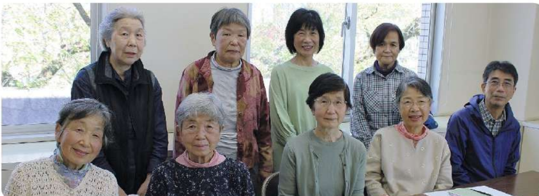
最後の総会に臨んだ青いぶどうの会の皆さん