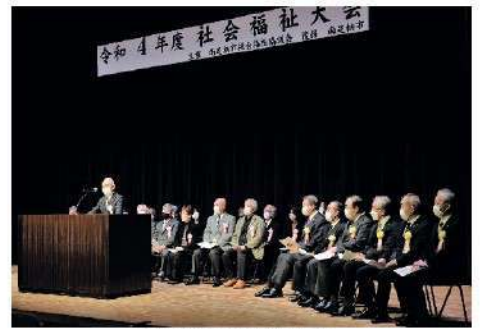
昨年度の社会福祉大会

第一部では、長年にわたり福祉分野で活躍されている方への表彰状・感謝状の贈呈、「ふくしの標語」優秀作品の発表・表彰を行います。また、第二部では、ボランティアや地域福祉活動について理解を深めていただくための講演会を予定しています。