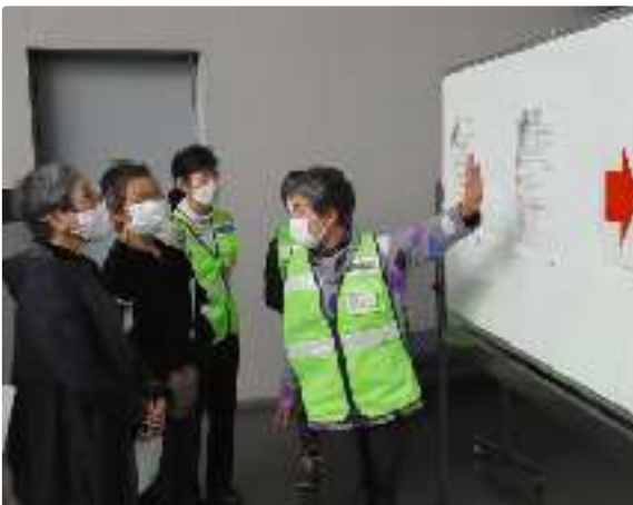
災害ボランティアセンター運営訓練の様子