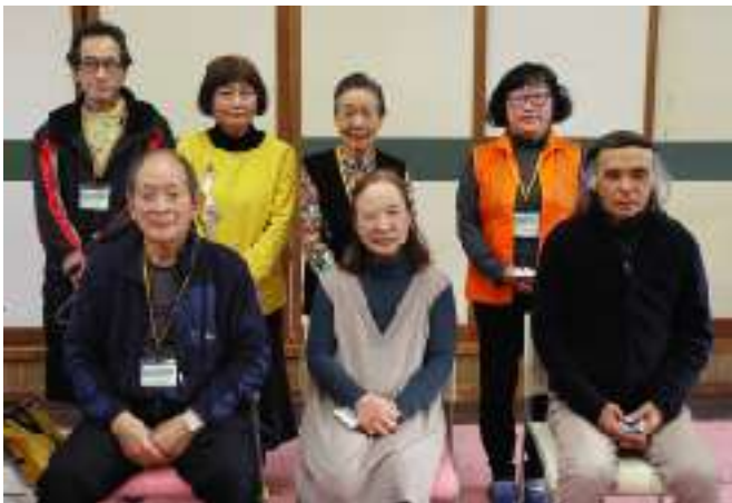
サポーターの皆さん、年に一度の集い

1月28日(土)、向田地区のおたがいさまネットの活動者が集まり、年間の報告と活動について意見交換をしました。地区として初めて実施した草むしり作業は、思った以上に時間がかかり、草むしり活動に登録されているサポーター以外にも声かけをして実施したとの報告もありました。「自分もできる範囲でやってみたい」と、地域の支え合い活動に前向きな意見が出されていました。