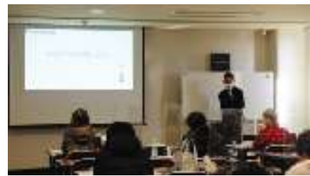
▲認知症について話を聞く 介助の仕方を学ぶ▶