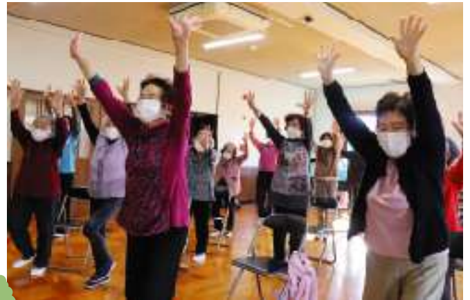
毎回違う楽しい体操