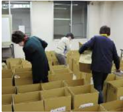
配布会に向けての準備

①生活困窮者への食料支援 食料支援「みなみのお福さん」事業等を通して、一時的に生活が困窮した世帯等を支援します。