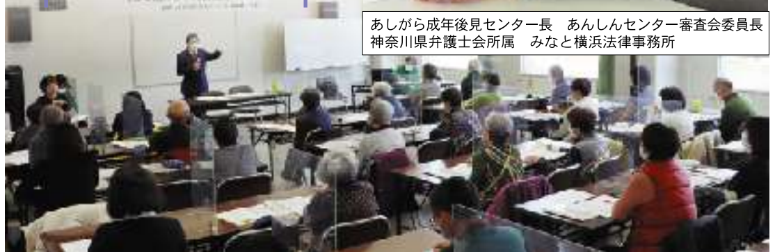
あしがら成年後見センター長 あんしんセンター審査会委員長 神奈川県弁護士会所属 みなと横浜法律事務所