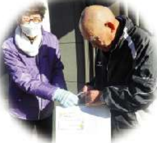
福祉会会長からお祝いの品を手渡し

1月10日(火)に、雨坪地域福祉会会長と新旧民生委員が、85歳以上の高齢者に長寿のお祝い品を贈呈しました。今年度の対象者は、39名で一軒一軒お宅を訪問しました。顔を会わせると「お元気でしたか?」「何か困っていることはありませんか?」「何か掛けた声がありました。」「毎年ありがとうございます」と声があり、笑顔も見られました。これからも健康に気をつけて、元気に過ごしていただきたいですね。