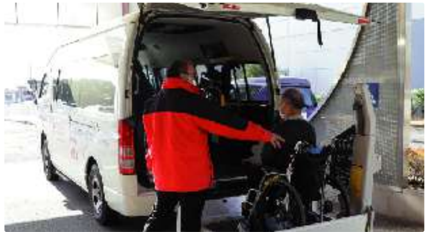
ハンディキャブ車での送迎

車いすを使用されている障害者や高齢者の病院への移動を支援します。また、今年度の秋ごろを目的に病院への通院だけでなく、市内の公共施設や銀行などへの送迎、買い物支援のための市内スーパーマーケットへの送迎、バリアフリーが整備されている駅までの送迎など、サービス提供範囲の拡充を図ります。