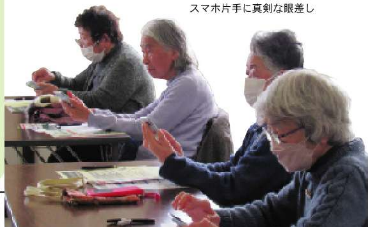
スマホ片手に真剣な眼差し

最初に、スマホの種類やアプリの基本操作について学び、LINE体験では、お隣同士でメッセージやスタンプを送り合ったり、音声入力に挑戦したりしました。参加者の中にはスマホに触ったことがない方もいらっしゃいましたが、講師やスタッフのサポートによって操作ができるようになりました。「少しはスマホ操作ができるようになった」「初めて知る機能もあった」「勉強になった」と嬉しい声が聞かれました。