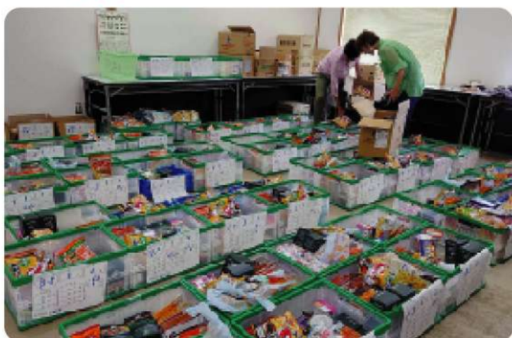
ボランティアにより配分された寄付品

「みなみのお福さん」では、社協に寄せられる食品や日用品を、必要としている世帯にお渡ししています。令和6年度は、3回の配布会を行いました。配布会に向けて、ボランティアが世帯毎に寄付品をセットしています。また、相談も随時受け付け、世帯状況に合わせて寄付品をお渡ししています。令和6年度の配布会利用者数は113世帯、日常的な配布数は62件でした（4月～1月）。地域の皆さまや協力団体・企業からのご協力で多くの方に寄付品をお渡しすることができました。ご協力ありがとうございました。