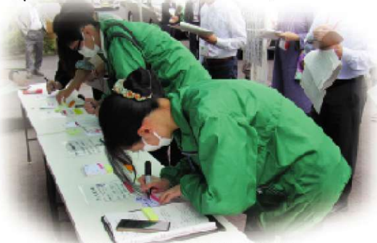
災害ボランティアセンター運営訓練受付の様子