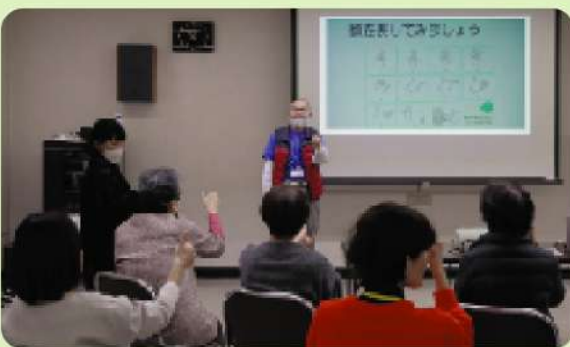
手話で数字の練習中

後半では、趣味や住所、場所の手話表現についての講義が行われました。参加者からは「実践形式で学べ、手話が身近になりました。実際に使っていききたい」といった声が聞かれました。