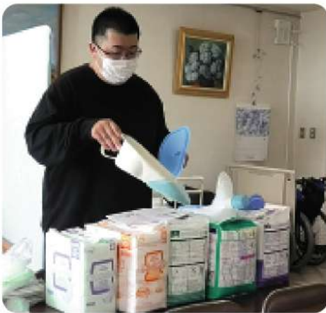
様々な介護用具の使い方を説明

今回、5名の受講生全員が修了試験に合格され、新たに介護職員として地域での活躍が期待されます。