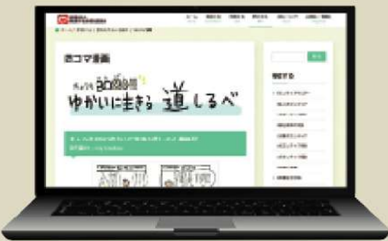
好評の「きょうも8080(ハレバレ)！ゆかいに生きる道しるべ」QRコードでご覧いただけます