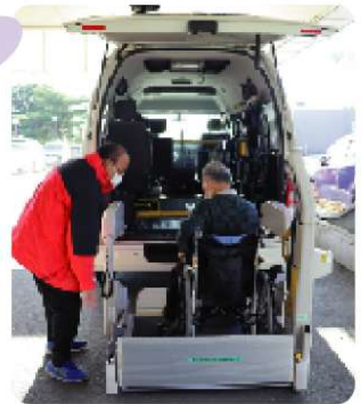
車いすで乗り込む