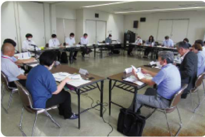
地域の事業所が集まり、課題を検討する地域ネットワーク連絡会

事業所が集まり、地域の課題に対して個々の専門性を活かし、解決に向けた検討を進めます。