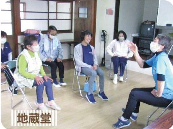
無理なくゆっくりやろう！

4月15日（水）に地藏堂公民館にて、介護予防サポーターによる体操会（通いの場）を開催しました。今回の体操会は、協議体（※）の話し合いでの「地域の方が集まる機会をつくりたい」「それなら、体操をしてみてはどうか」という意見から実施に至りました。介護予防サポーターから「無理のない範囲でやってみましょう」と声を掛けられ、椅子を使った体操を中心に体験しました。今後は、定期的集まれる場として体操会の実施を検討していくとのことです。