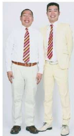
レギュラーのおふたり

今年度の社会福祉大会は、式典・講演会の他、昨年度ご好評いただいた文化会館展示室やりんどう会館前での展示、物販等、楽しんで交流いただける企画を行います。講師は介護職員初任者研修の修了資格も持つ漫才師「レギュラー」のお二人に決定。詳細は次号広報誌でお知らせします。