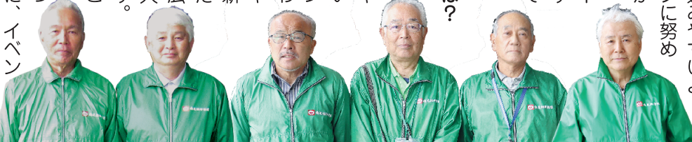
ハンディキャブ車のドライバー

Q 総務企画班として今後取り組みたいことは? A 共同募金や社会福祉大会の他にもすべての職員が関われるイベントや企画を増やしていきたいと考えています。イベント等を通して、普段関わることがない地域の人や関係者と接する事で、新しい考え方を取り入れたり、自分の仕事の幅を広げたりと、職員一人一人の成長にもつながります。また、みんなで一つのことに取り組むことで、職員の一体感向上にもつながります。このように、イベントの実施など、限られた人員で効率的に業務が進むよう取り組みたいと考えています。