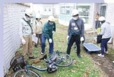
災害ボランティア訓練の様子

2,932千円 47.1% 災害時ボランティアの養成・生活困窮者への食料支援・ボランティア団体への助成など