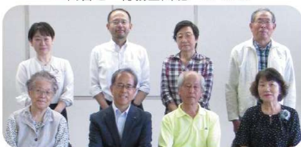
推進評価委員の皆さん

令和7年度の社協事業について推進評価委員会を開催 社協では、専門的かつ客観的な立場から社協事業について評価を受け、さらなる事業向上を目指すため、学識経験者、民生委員児童委員等の第三者委員による「推進評価委員会」を設けています。 令和7年度事業について、評価を受け、答申書をいただきました。この答申内容について、今年度の事業に生かしていきたいと考えています。 評価内容、指摘事項については、社協ホームページをご覧ください。