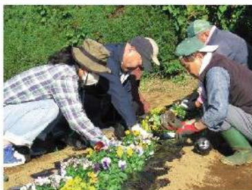
地域福祉会の活動

650千円 10.5% 地域福祉会への支援や助成・おたがいさまネットの活動支援・地域への福祉活動機材の貸出など