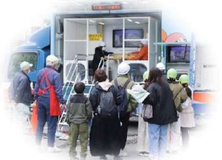
社会福祉大会での起震車体験