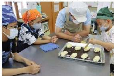
寺子屋でのパン作り