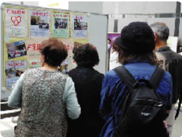
パネルの前で足を止める来場者

会場内にてボランティア協会所属グループの活動紹介パネル展示を行いました。多くの方が足を止める様子もあり、ボランティア協会の活動を知っていただく機会となりました。 ※本上映会は、文化会館が主催し、ボランティア協会と社協が協賛して開催しました。