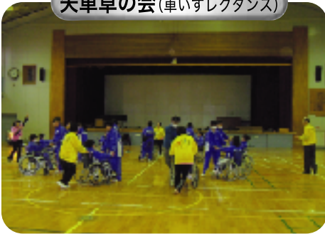
矢車草の会(車いすレクダンス)