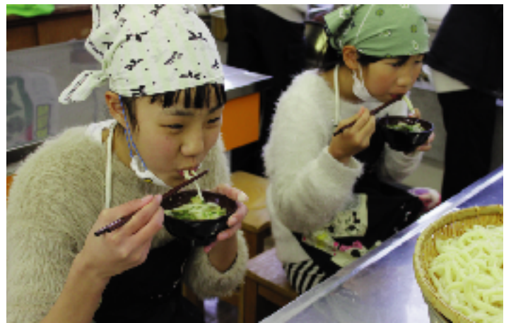
自分たちで作ったうどん「おいし〜い!」

りの流れを児童に伝授。福祉会の方たちは子どもたちの作業を見守り、時にはアドバイス。美味しそうなだし汁の香りが調理室いっぱいに広がる中、力を合わせて調理しました。