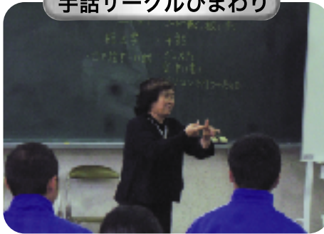
手話サークルひまわり