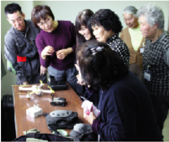
様々な活動用備品に触れる災害ボランティアの皆さん

市社協災害ボランティアに登録された方の学習会が、2月8日(木)りんどう会館にて開催されました。「その手で守ろう!南足柄を」と題した講演会では、講師の小田原市消防職員協議会の方々から、「災害時には支援が必要な人を把握し、必要な情報を届けること等意識してほしい」と、災害ボランティアの役割や心構えの話がありました。 講演に続き、グループワークとして、避難所運営ゲーム(※HUG)を行いました。