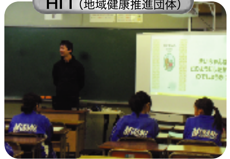
HIT (地域健康推進団体)