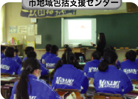
市地域包括支援センター