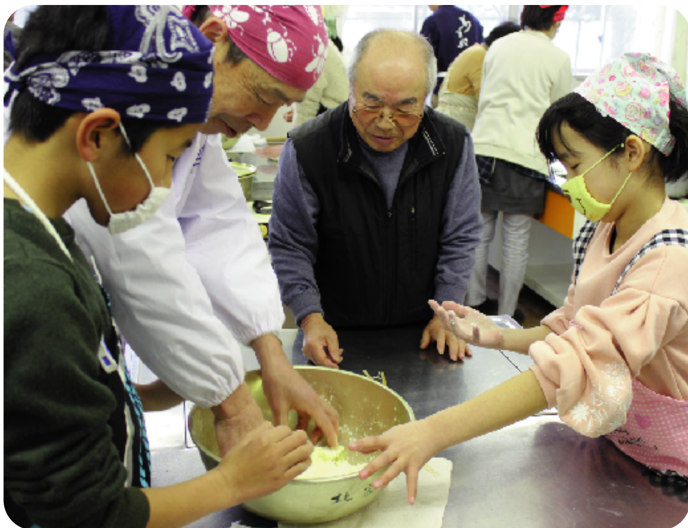
内山福祉会が北足柄小学校児童のうどん作りをサポート